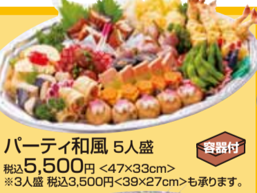
Party和風 5人盛 税込5,500円 <47×33cm> ※3人盛 税込3,500円<39×27cm>も承ります。