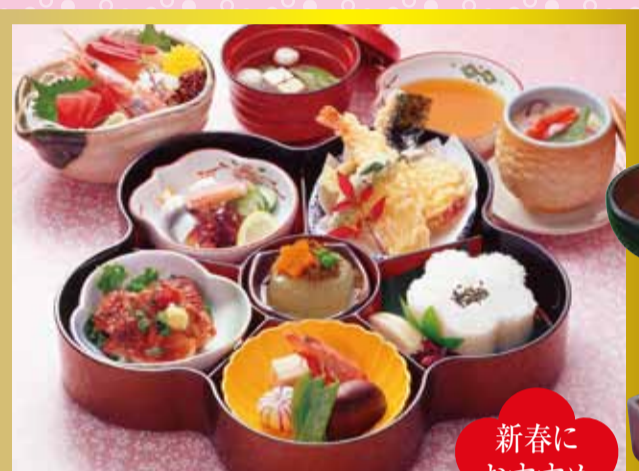
梅弁当 / うめべんとう <32×32cm> 税込3,024円を 特別価格 税込2,880円 新春におすすめ