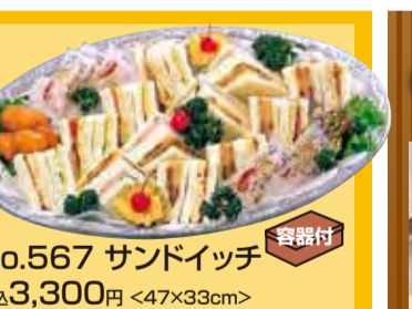
No.567 Partyサンドイッチ 税込3,300円 <47×33cm>