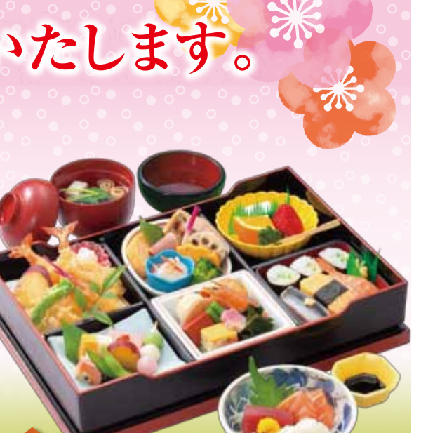
定番人気 No.3 No.17 税込3,400円 <39×26.5cm>