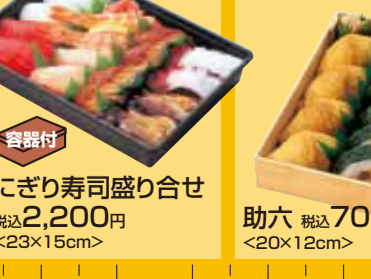
Partyにぎり寿司盛り合せ 税込2,200円 <23×15cm>