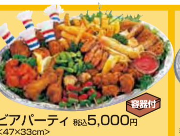
Partyパーティ 税込5,000円 <47×33cm>