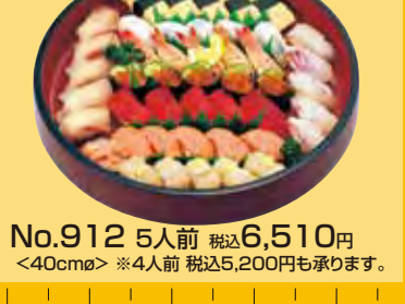
No.912 Party 5人前 税込6,510円 <40cm> ※4人前 税込5,200円も承ります。