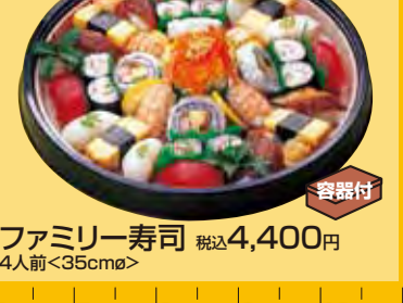
Partyファミリー寿司 税込4,400円 <4人前<35cm>