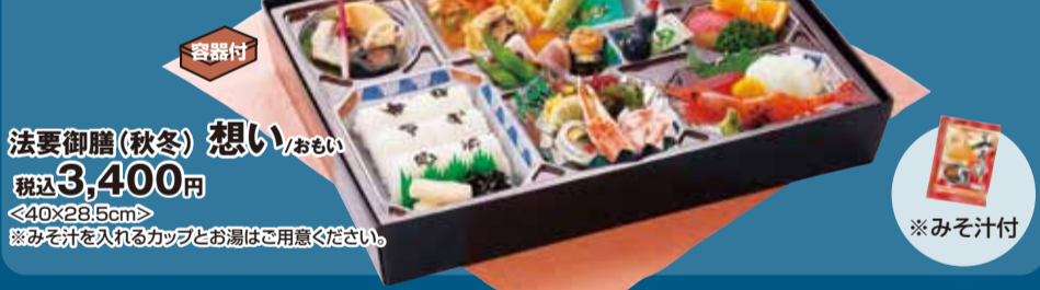
法要御膳(秋冬) 想い / おもい 税込3,400円 <40×28.5cm> ※みそ汁を入れるカップとお箸はご用意ください。 ※みそ汁付