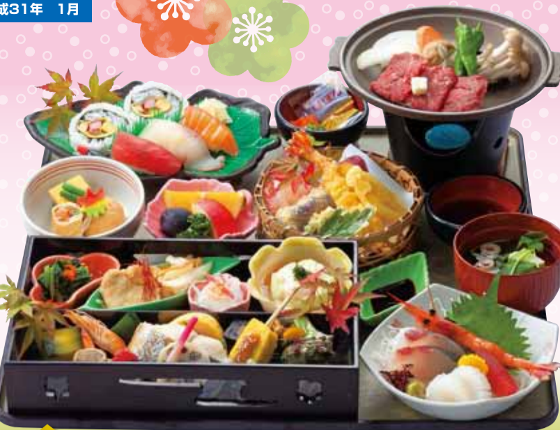
定番人気 No.1 OK 若草膳 / わかくさぜん 税込4,450円 ステーキ半陶板焼 ※お膳(45×45cm)・脚付 ※配膳された状態でお届けします。