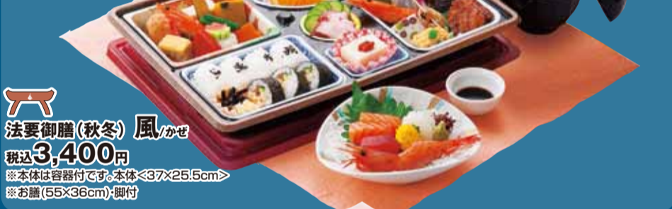
法要御膳(秋冬) 風 / かぜ 税込3,400円 ※本体は容器付です。本体<37×25.5cm> ※お膳(55×36cm)・脚付