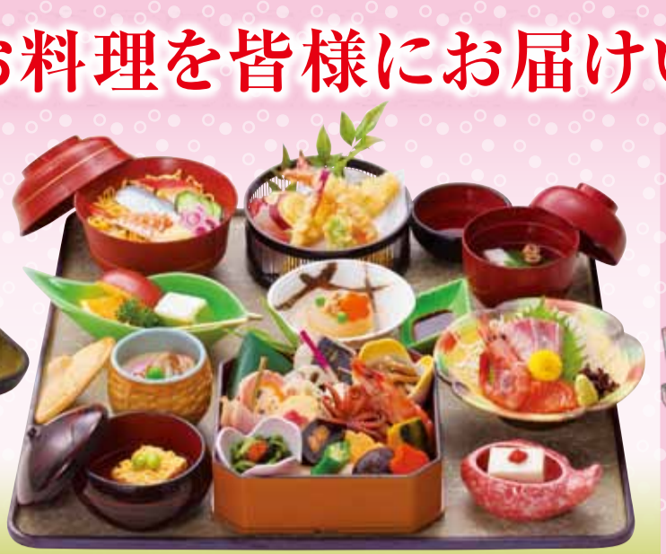
新 OK 華の御膳 / はなのごぜん 税込3,780円 ※お膳(45×45cm)・脚付 ※配膳された状態でお届けします。