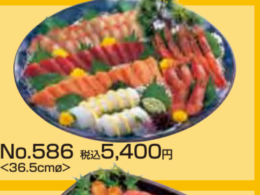
No.586 税込5,400円 <36.5cm>