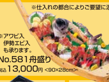
No.581 Party舟盛り 税込13,000円 <90×28cm>