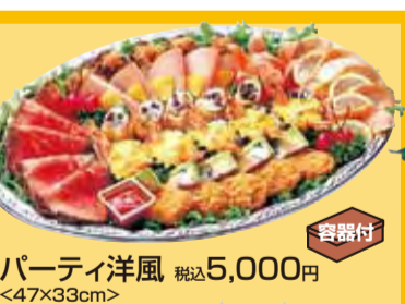
Party洋風 税込5,000円 <47×33cm>