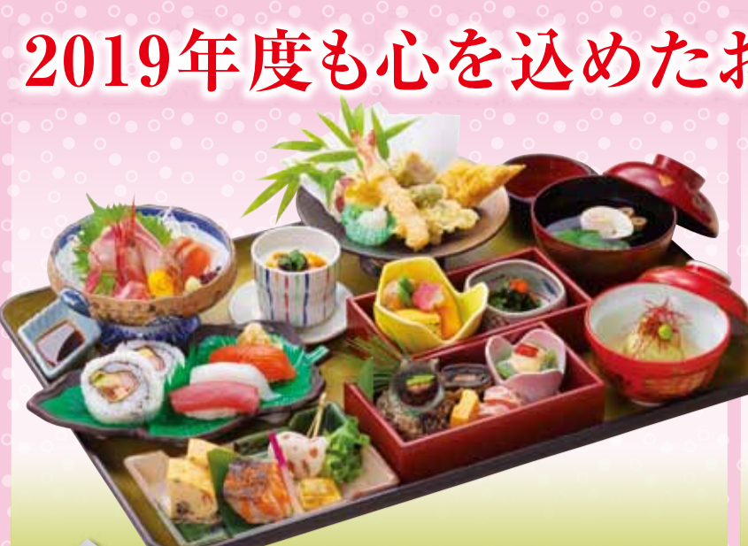
定番人気 No.2 新 OK 恵比寿 / えびす 税込3,810円 ※お膳(55×36cm)・脚付 ※配膳された状態でお届けします。