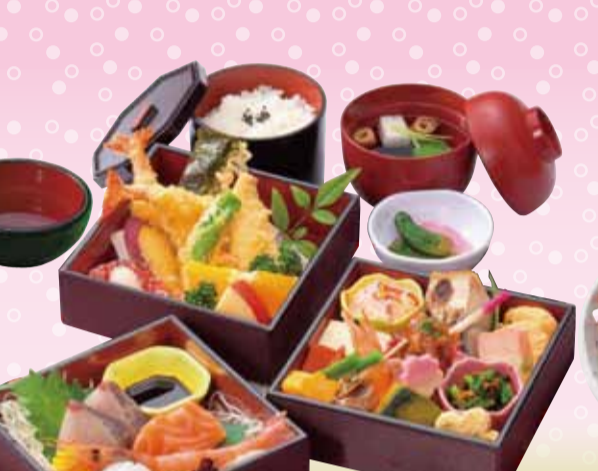
三宝御膳 /さんぼうごぜん 税込3,200円 <15×15cm×3段>