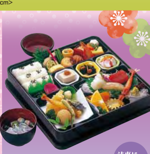
No.617 税込3,300円 <30×30cm> 法事に おすすめ