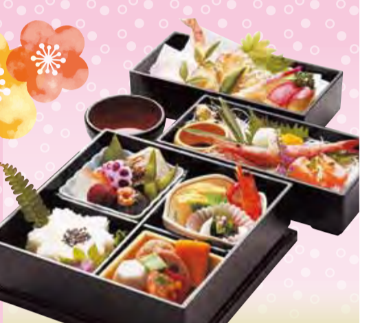
福寿 / ふくじゆ 税込2,000円 <21×21cm×2段>