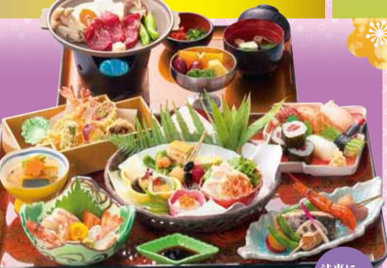
OK 春麗 / しゅんれい 税込5,400円 季節の八寸 ※お膳(55×36cm)・二の膳(37×26cm)・脚付 握り寿司6種盛り ※配膳された状態でお届けします。 法事に おすすめ