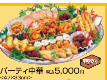
Party中華 税込5,000円 <47×33cm>