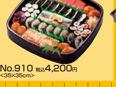
No.910 税込4,200円 <35×35cm>