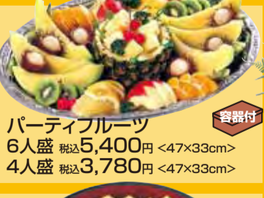
Partyフルーツ 6人盛 税込5,400円 <47×33cm> 4人盛 税込3,780円 <47×33cm>