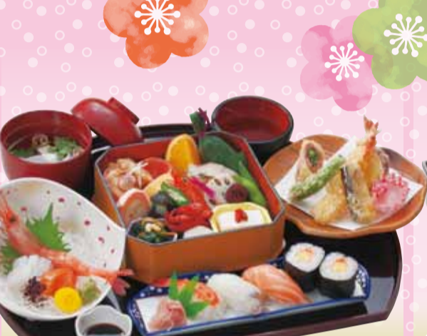
OK 若菜 / わかな 税込2,400円 ※お膳(42×35cm)付 ※配膳された状態でお届けします。