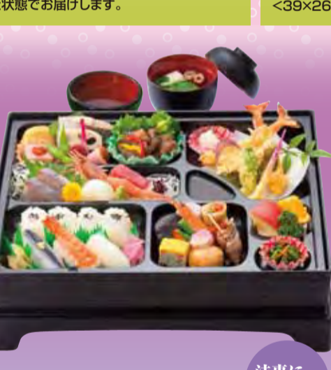
No.616 税込3,810円 <39×32cm> 法事に おすすめ