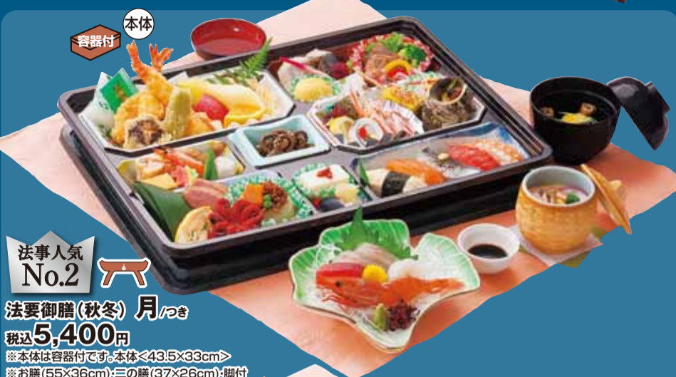
法事人気 No.2 新 法要御膳(秋冬) 月 / つき 税込5,400円 ※本体は容器付です。本体<43.5×33cm> ※お膳(55×36cm)・三の膳(37×26cm)・脚付

法要御膳の月・山・風・想いを16,200円以上ご注文いただいたお客様に、通常価格 税込1,080円の「お供えBOX」を1組、お料理と一緒に無料でお届け致します。 お供えBOX 税込1,080円