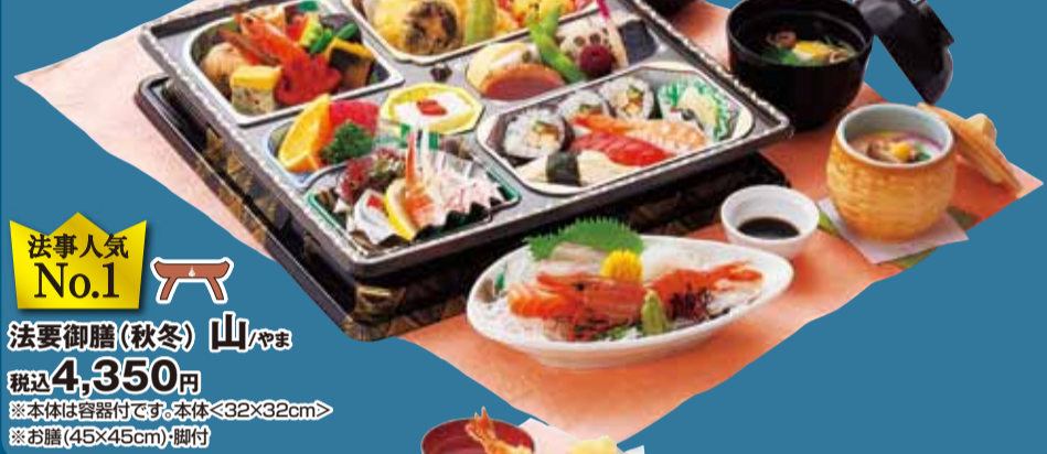
法事人気 No.1 新 法要御膳(秋冬) 山 / やま 税込4,350円 ※本体は容器付です。本体<32×32cm> ※お膳(45×45cm)・脚付