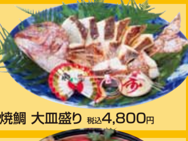
焼鯛 大皿盛り 税込4,800円