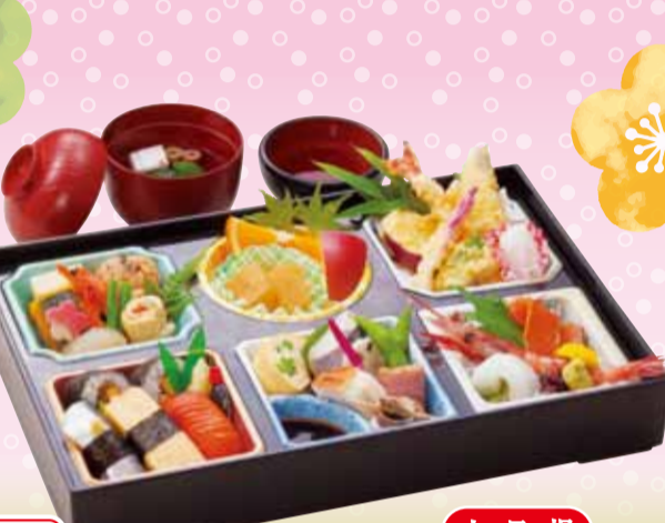
新 休日堂 / きゅうじつどう 特別価格 税込2,200円 <39×26.5cm> 土・日・祝のみお届けできます。